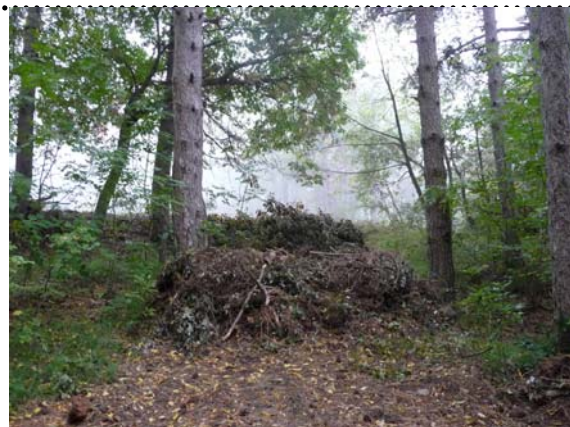
Il sentiero interrotto anche su proprietà comunale

Il sentiero, infatti, è stato bloccato con massi e tronchi in due punti, uno a monte ed uno a valle di detto appezzamento, distinto indicativamente alle part. 54-55-56 del foglio 133 del Comune di Ascoli Piceno. E' evidente che la debolezza dimostrata nella difesa degli interessi collettivi ha fatto sì che qualcun altro ne approfittasse ed ora la situazione si è fatta ancora più ingarbugliata e pesante.