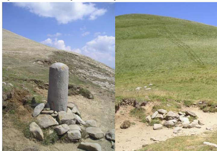
Il cippo della Macera della Morte, prima e dopo la scomparsa

E' stato ritrovato il cippo della Macera della morte che con un atto vandalico gratuito era stato fatto rotolare nella scarpata sottostante. Lì è stato scovato grazie all'azione di tanti soci CAI e di appassionati della montagna che in questo periodo si sono prodigati nella ricerca. E' stata immediatamente avvertita la Stazione Forestale di S. Martino competente per zona, la quale effettuerà un sopralluogo per valutare le modalità di recupero del cippo ed il suo ricollocamento nel posto dove da oltre 150 anni costituisce il termine di confine di tre regioni: Abruzzo, Lazio e Marche. L'allarme era scattato il 4 agosto durante un'escursione organizzata da alcuni soci: stupiti per la sua assenza, hanno dato un'occhiata sommaria attorno caso mai fosse stato fatto rotolare giù per la scarpata, ma la breve ricerca non aveva prodotto gli effetti sperati. Da informazioni assunte presso la Stazione di S. Martino del Corpo Forestale dello Stato si è saputo che il cippo era stato visto qualche giorno prima a terra e