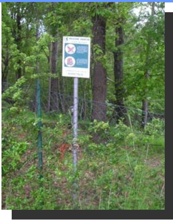
Il cartello della Regione Marche rimasto inglobato nella proprietà recintata