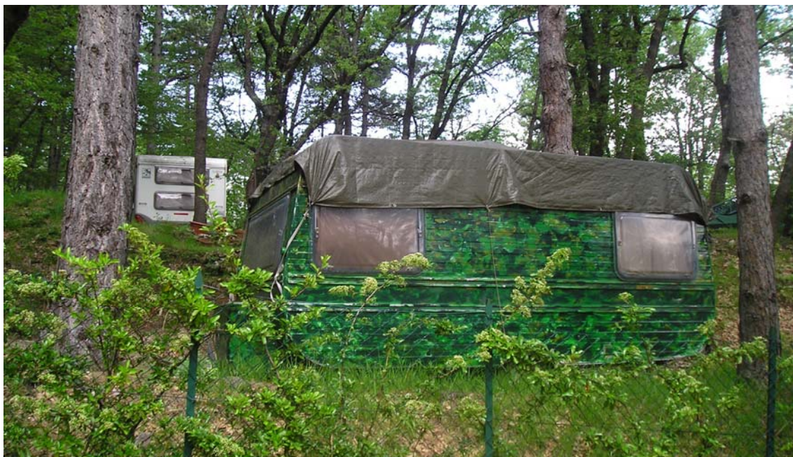
Le roulotte all'interno del recinto, simbolo del degrado di Colle S. Marco

Sono molte le sezioni CAI che hanno un bollettino periodico con il quale vengono integrate le notizie riportate su La Rivista nazionale inviata a tutti i soci. Anche la nostra Sezione ha sentito l'esigenza di rendere partecipe i propri soci sia delle riflessioni fatte in Consiglio su alcuni temi d'interesse generale per la vita associativa sia dei risultati delle iniziative più significative svolte nel corso dell'anno dalle varie Commissioni. Le attività in Sezione, svolte in più settori così diversi tra loro, sono alla fine tante e si rischia di non dare loro il respiro che meritano; succede così che i soci che praticano una disciplina non conoscono che cosa accade nelle altre. Per il momento usciamo con alcuni numeri prova inviati in formato digitale ai soci che hanno l'indirizzo e-mail, mentre gli altri possono reperire il bollettino sul sito internet, oppure passare in sede dove sono a disposizione alcune copie cartacee. Per il momento il nome del bollettino, www.caiascoli.it , richiama quello del sito ma è stata avviata una fase di consultazione tra i soci per individuare uno definitivo.