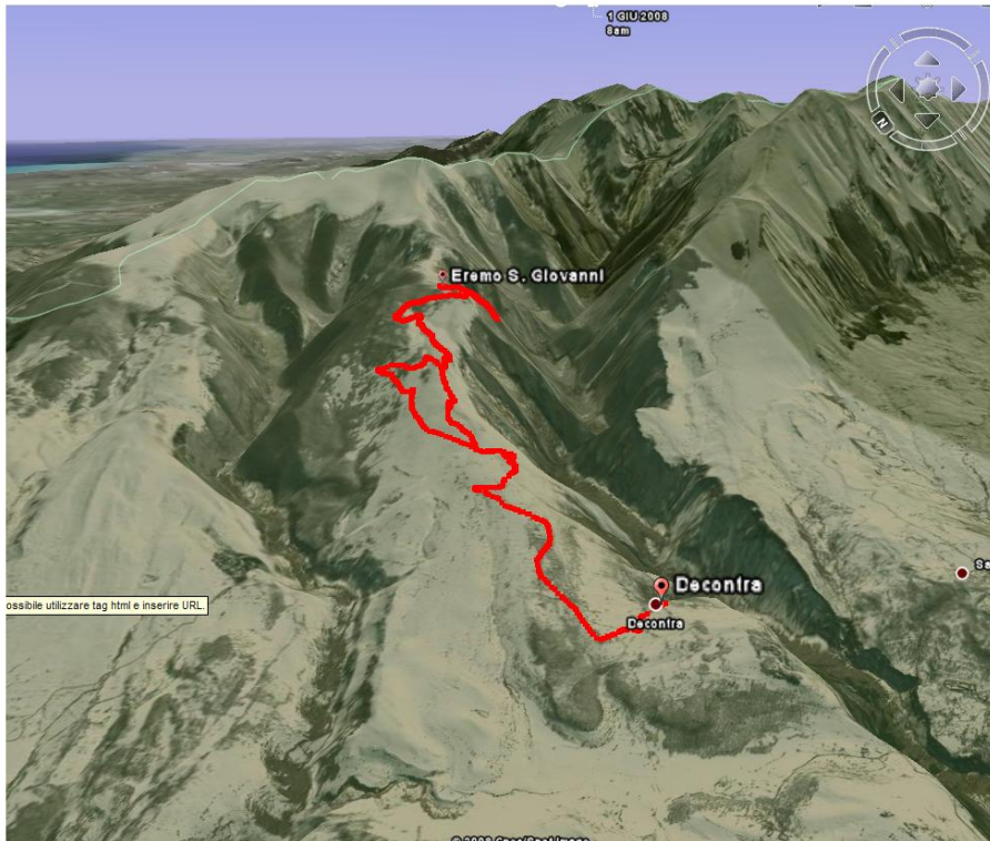
IMMAGINE GOOGLE EARTH VISTA DIREZIONE SUD-EST

Per ulteriori informazioni e per effettuare prenotazioni potete rivolgervi presso la sede del CAI ogni mercoledì e venerdì dalle ore 19 alle 20, telefonare allo stesso orario allo 0736 45158 oppure consultare il ns. sito www.slowbikeap.it