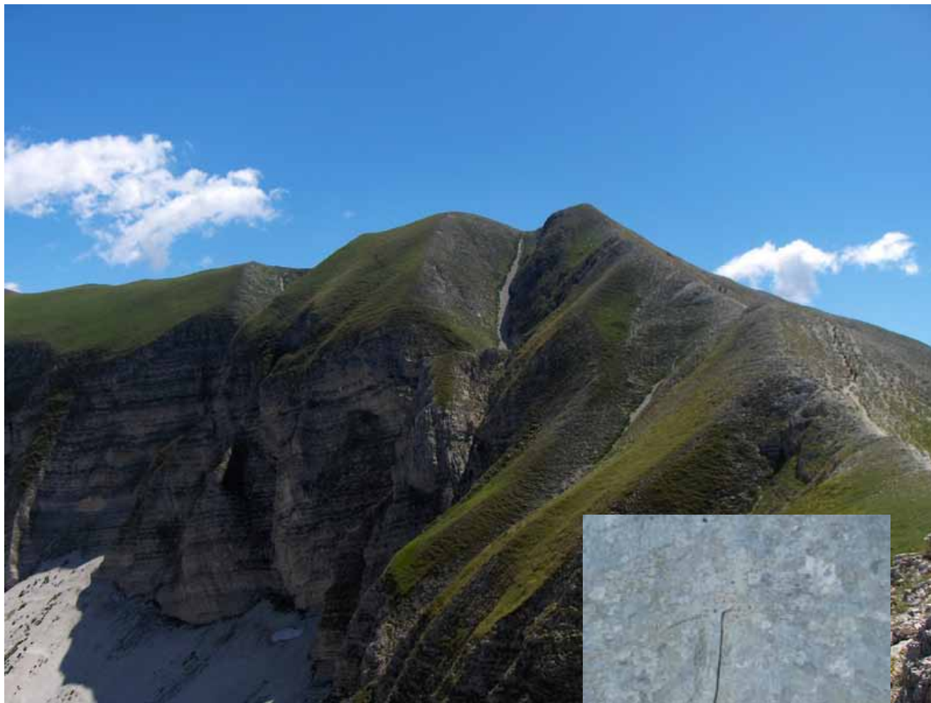
Monte Bove Sud