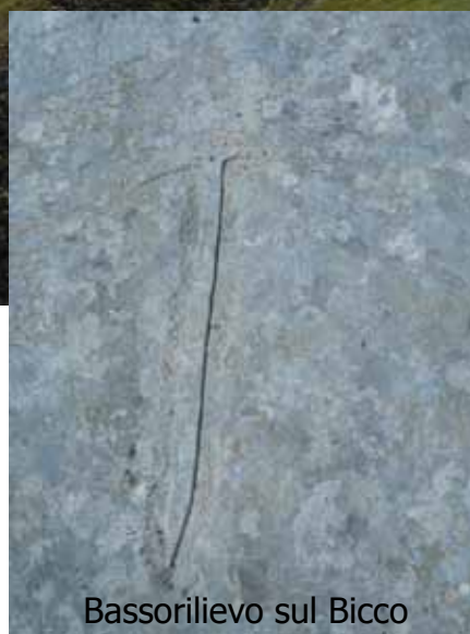
Bassorilievo sul Bicco

Per ulteriori informazioni e per effettuare prenotazioni potete rivolgervi presso la sede del CAI ogni mercoledì e venerdì dalle ore 19 alle 20, telefonare allo stesso orario allo 0736 45158 oppure consultare il ns. sito www.caiascoli.it