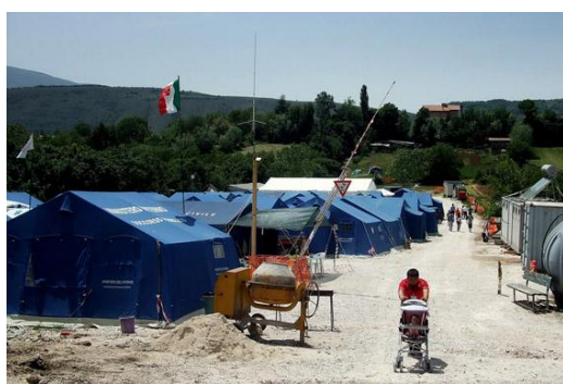
Campo di Tempera

Lunedì 6 aprile 2009, ore 3,32: l'orologio di S. Biagio a Tempera si ferma a segnare per sempre il momento della violenta scossa di terremoto che ha colpito L'Aquila. Tempera subisce i danni più gravi, insieme alle altre frazioni Bazzano, Onna, Pescomaggiore, San Gregorio, Paganica che insieme costituiscono la X Circoscrizione delle dodici in cui è suddiviso il territorio aquilano.