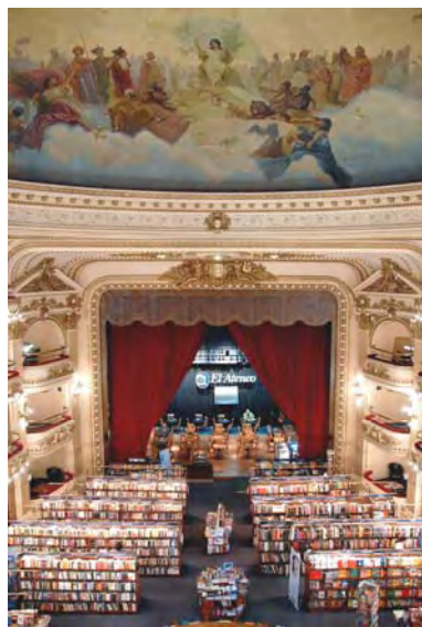
La libreria "El Ateneo" a Buenos Aires, affrescata da Orlandi

Qualche anno dopo, il 19 giugno del 1887, Orlandi partecipa ad un'altra escursione, questa volta a Pizzo di Sevo, riportando su incarico del direttore del "Pape Satan" (giornale nel quale pubblica i suoi disegni), una originalissima "relazione disegnata" dell'escursione: "... aborrendo le solite smancerie retoriche che infiorano troppo i dati scientifico-geografici, abbiamo preferito affidare la relazione alla matita dell'amico Orlandi ...", il quale al suo rientro pubblica quattro disegni sull'escursione. In questi anni Orlandi continua l'attività di pittore partecipando alla Biennale di Venezia, nell'edizione 1887 con cinque sue opere; l'anno dopo, nel 1888, attratto dalla fama, acquistata in America Latina, dall'architetto ascolano Francesco Tamburrini, parte alla volta di Buenos Aires dove inizia una lunga e brillante carriera che terminerà all'età di 91 anni quando il 2 maggio del 1952 muore nella capitale