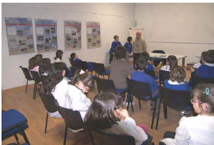
Le scolaresche durante l'incontro. Sulle pareti sono esposti i manifesti della mostra sulle aggressioni ambientali subite dell'Appennino Umbro Marchigiano