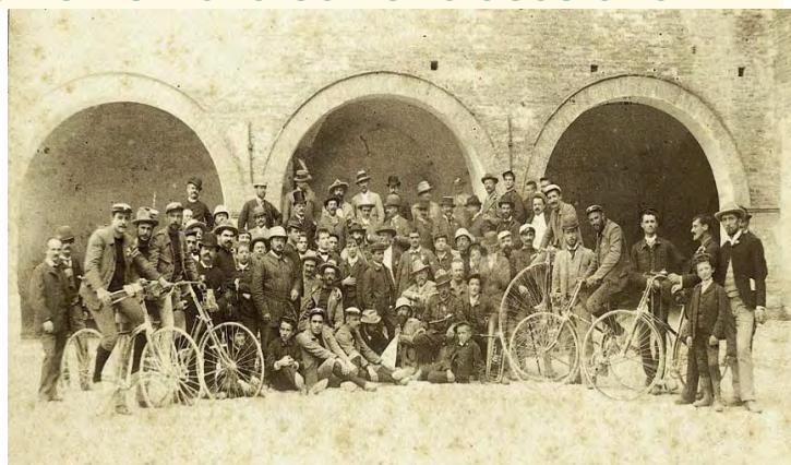
Convegno nazionale CAI in Amandola - 1889