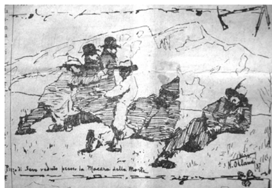
"Pizzo di Sevo veduto presso la Macera della Morte"