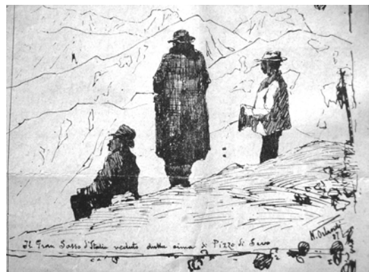
"Il Gran Sasso d'Italia veduto dalla cima di Pizzo di Sevo"