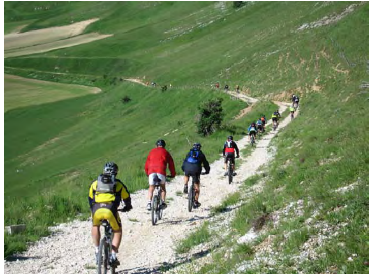
Scendendo da Castelluccio di Norcia - Giugno 2008