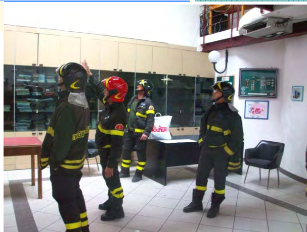
I vigili del fuoco all'interno della sede di via Sassa del CAI aquilano