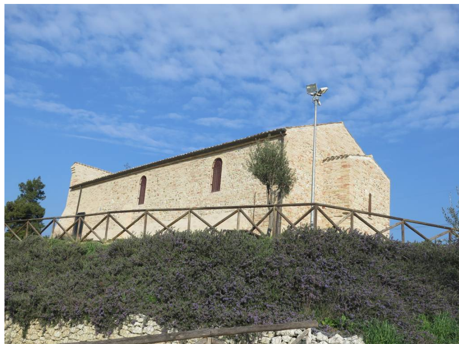
ABBAZIA SS. BENEDETTO E MAURO