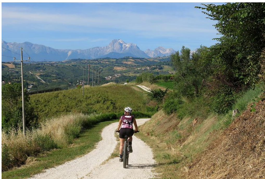
Avvicinamento a S. Onofrio con vista sul Gran Sasso.