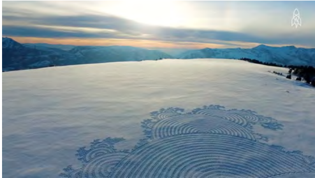
disegno di Simon Beck