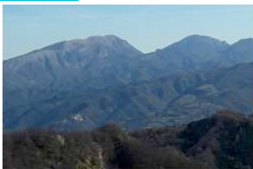
Montagna dei Fiori dal Ceresa