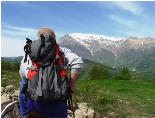
Affaccio sul Vettore

Abetito conserva un gruppo omogeneo di case settecentesche, prive di decorazioni, ma con pareti di compattezza e regolarità considerevoli che mettono in pieno risalto la materia costruttiva. La Chiesa di S. Pietro manifesta origini medievali, con navata unica, absidata sul fondo del presbiterio; alcuni marchi cruciformi di tradizione medievale punteggiano le superfici. All'interno, una cornice d'imposta mostra la data 1570 relativa ai restauri che hanno dato all'edificio l'aspetto attuale, data alla quale risale anche la vasca battesimale monolitica su base ottagonale. Nella chiesa si conserva una croce astile di scuola sulmonese.