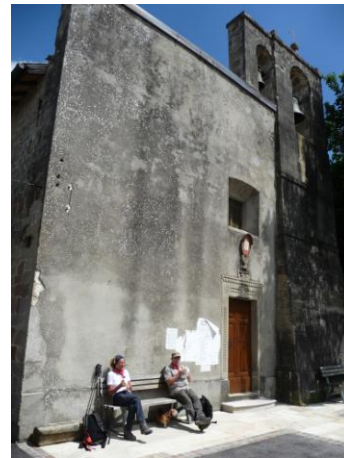
S. Pietro di Abetito