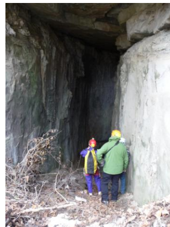
Grotta dei Ladri

Per ulteriori informazioni e per effettuare prenotazioni potete rivolgervi presso la sede del CAI ogni mercoledì e venerdì dalle ore 19 alle 20, telefonare allo stesso orario allo 0736 45158 oppure consultare il nostro sito www.caiascoli.it